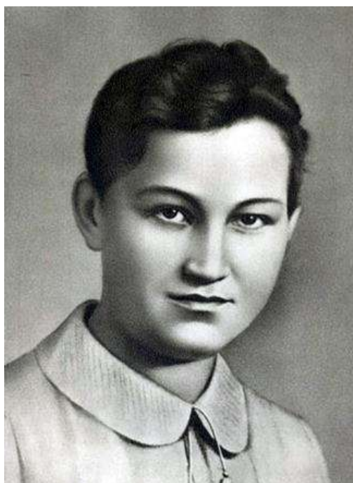
Зоя Анатольевна Космодемьянская

Космодемьянская Зоя Анатольевна родилась 13 сентября 1923 года в деревне Осинов Гай Гавриловского района Тамбовской области в семье учителей. С 1930 года семья жила в Москве, где Зоя закончила школу.