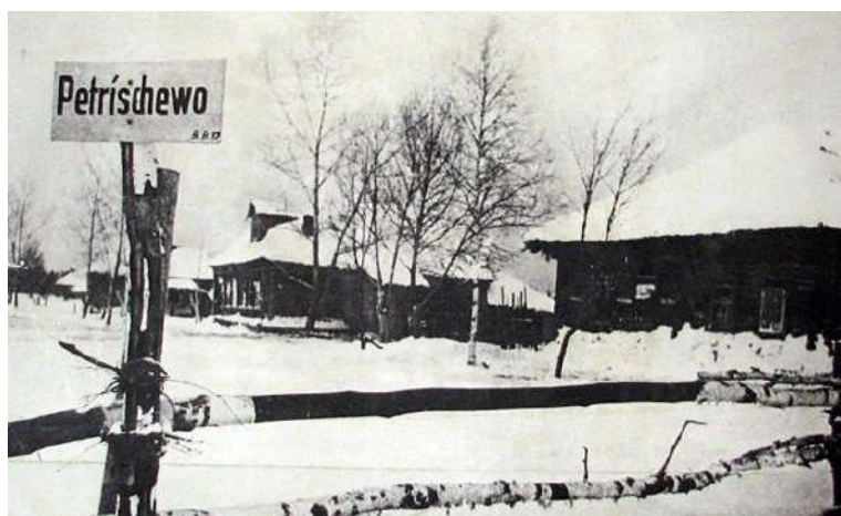
Деревня Петрищево, где была казнена Зоя Космодемьянская

Космодемьянская получила новое боевое задание, в котором