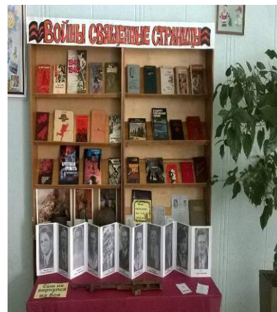
Выставка-экспозиция «Войны священные страницы»

Недалеко расположилась выставка - экспозиция «Войны священные страницы», посвященная 70-летию освобождения Беларуси от немецко-фашистских захватчиков, на которую часть