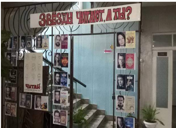
фотовыставка «Звезды читают, а ты?!»

Затем все присутствующие были приглашены в здание Ракитницкого дома культуры, где их ждали в фойе беспроигрышная лотерея «Миг удачи» и фотовыставка «Звезды читают, а ты?!».