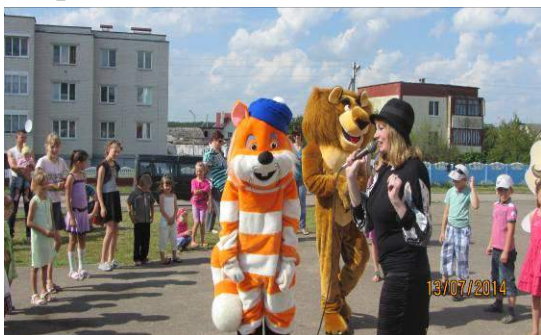
Во время театрализованной игровой программы «Книга, дети и игра – неразлучные друзья»