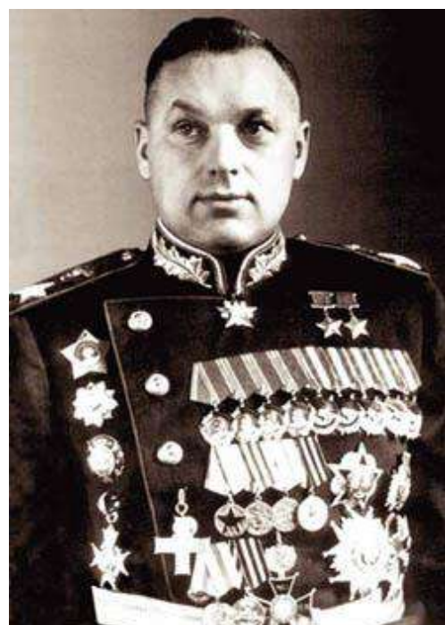
Константин Константинович Рокоссовский

Рокоссовский Константин Константинович родился 21 декабря 1896 года в городе Варшава (Польша). Работал на трикотажной фабрике, каменотесом. В армии с 1914 года, участник 1-й мировой войны. В Красной Армии с 1918 года. За боевые заслуги в годы Гражданской войны награжден двумя орденами Красного Знамени, за боевые отличия во время конфликта на Китайско-Восточной железной дороге – третьим орденом Красного Знамени. Окончил кавалерийские курсы усовершенствования комсостава, курсы усовершенствования высшего начсостава Военной академии им. М.В.Фрунзе. До 1941 года – командир кавалерийского полка, бригады, дивизии, корпуса.