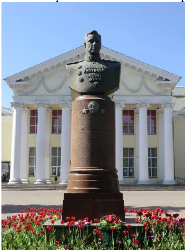
Первый памятник Константину Константиновичу Рокоссовскому в г. Великие Луки

Маршалу Рокоссовскому установлены памятники в городах Москва, Волгоград, Легница (Польша), бронзовые бюсты – в городах Курск, Гомель (Белоруссия), Сухиничи (Калужская область), Великие Луки и других, мемориальные доски. Именем героя названы бульвар в городе Москва, проспект в городе Минск, улицы в городах Барановичи, Бобруйск, Волковыск,